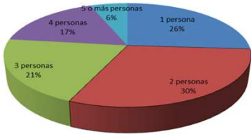
Composición de los hogares en España (según el número de miembros que lo componen)

El 56% de los hogares en España está compuesto por 1 o 2 miembros.